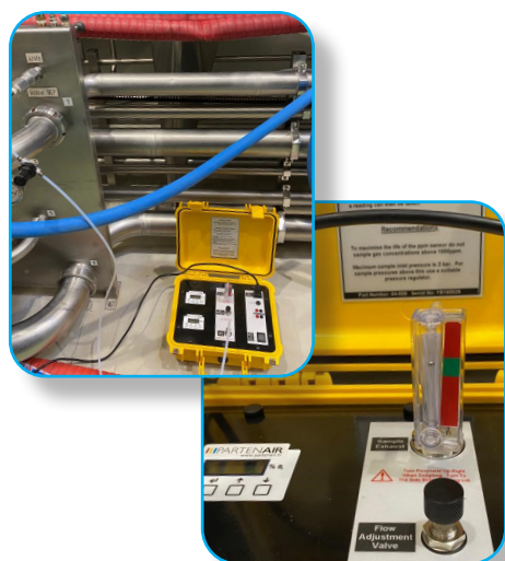
↳ Mesure sur site

L'analyseur d'oxygène (O 2 ) est une valise de mesure portable qui permet de mesurer le taux d'oxygène afin d'analyser le taux de pureté de votre production d'azote . La pureté est exprimée en ppm* ou en pourcentage d'oxygène. PARTENAIR vous propose désormais une nouvelle prestation de mesure sur site pour garantir la qualité de vos produits finis et répondre aux exigences réglementaires de votre secteur d'activité .