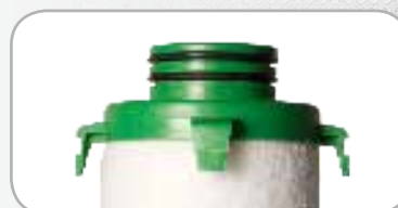
Code couleur éléments filtrants série PX5 : Vert

(*) Débits indiqués selon ISO 7183 (20°C et 1 bar absolu) sous 7 bars relatifs