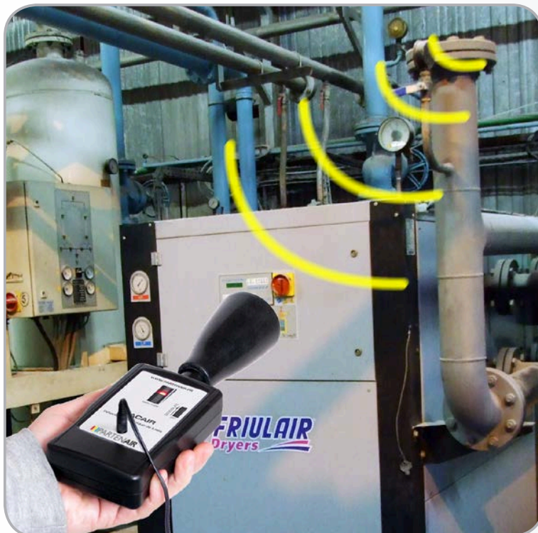
Une utilisation simple et intuitive