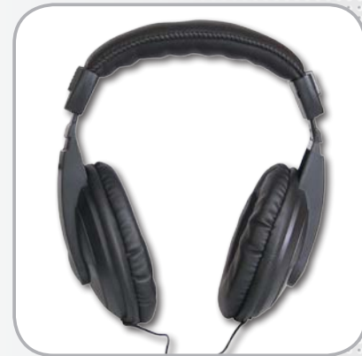
Casque confortable à forte atténuation de bruit (23 dB)