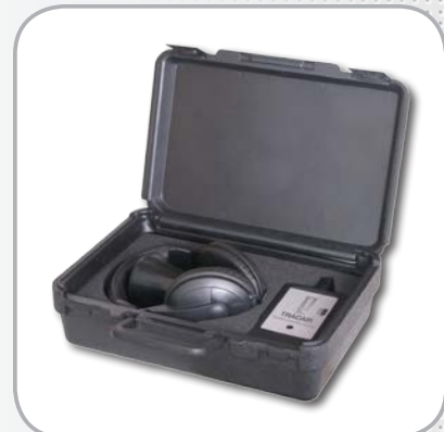
Valise de transport et de protection fournie