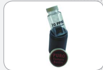
Kit de tests