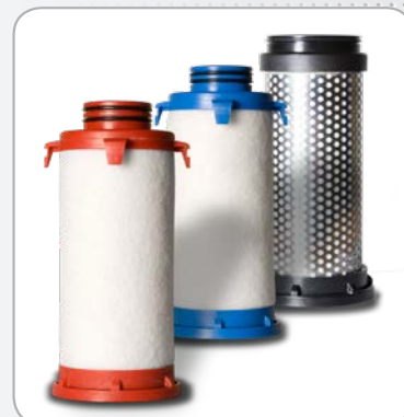
Eléments filtrants avec codes de couleur et numéros de lots pour traçabilité.