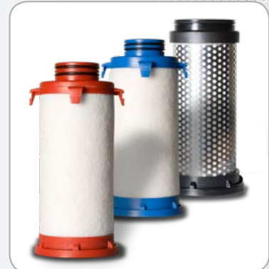
Eléments filtrants avec codes de couleur et numéros de lots pour traçabilité.

Débits indiqués selon ISO 7183 (20°C et 1 bar absolu) sous 7 bars relatifs