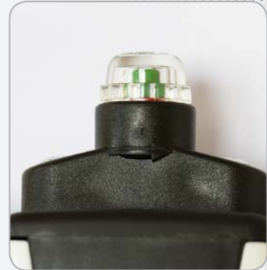
Indicateur de saturation.