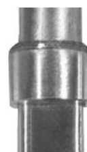
Capteur de débit massique thermique