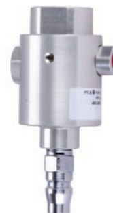
Chambre de mesure avec raccord rapide. (MAC 1270)