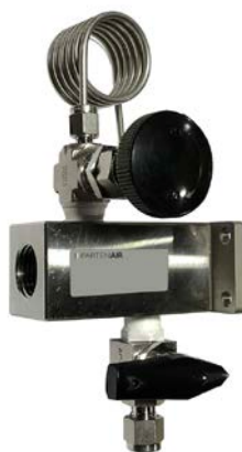
Chambre de mesure acier inoxydable avec vannes d'entrée/sortie et raccord à compression pour l'alimentation en gaz. (MAC 1305)