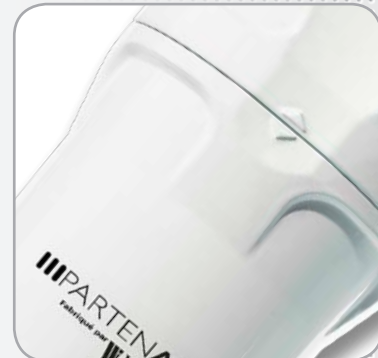
Nouveau bol avec butée de vissage Évite tout sur-serrage, facilite la pose/dépose.

(*) Débits indiqués selon ISO 7183 (20°C et 1 bar absolu) sous 7 bars relatifs