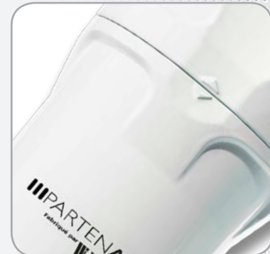
Nouveau bol avec butée de vissage Evite tout sur-serrage, facilite la pose/dépose.

(*) Débits indiqués selon ISO 7183 (20°C et 1 bar absolu) sous 7 bars relatifs