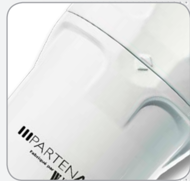
Nouveau bol avec butée de vissage Évite tout sur-serrage, facilite la pose/dépose.

(*) Débits indiqués selon ISO 7183 (20°C et 1 bar absolu) sous 7 bars relatifs