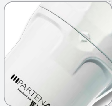
Nouveau bol avec butée de vissage Evite tout sur-serrage, facilite la pose/dépose.

(*) Débits indiqués selon ISO 7183 (20°C et 1 bar absolu) sous 7 bars relatifs