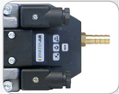
Voyants de contrôle et test de purge