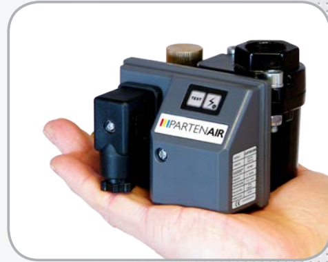
Modèle extrêmement compact.