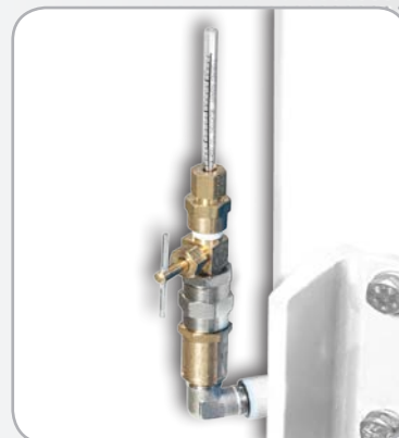
Tube de mesure d'huile résiduelle (Option sur CLX 5 A à 110 A)