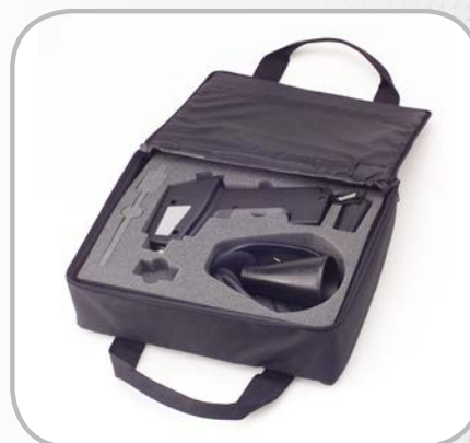
Fourni avec mallette de transport anti-choc comprenant tous les accessoires nécessaires.