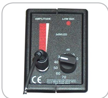
Indicateur visuel à LED Témoin de batterie et réglage de sensibilité