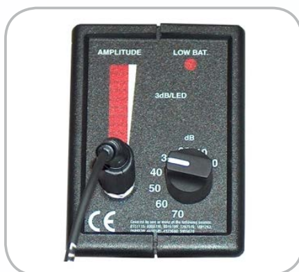
Indicateur visuel à LED Témoin de batterie et réglage de sensibilité