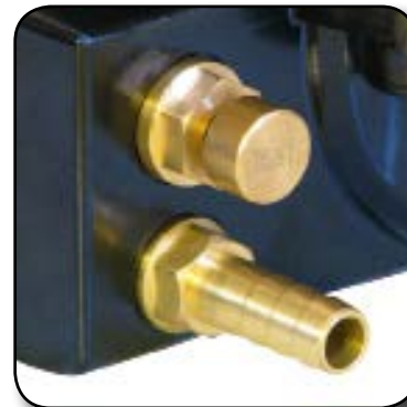
Bouton de test