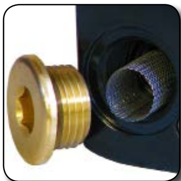
Crépine de protection