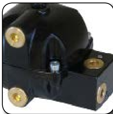
3 raccords d'entrée