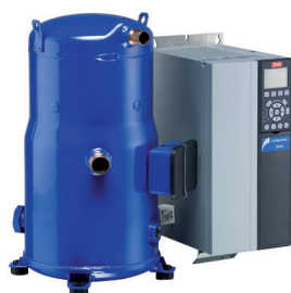
CONSOMMATION D'ÉNERGIE Index 100 = Gamme FRIOVAR