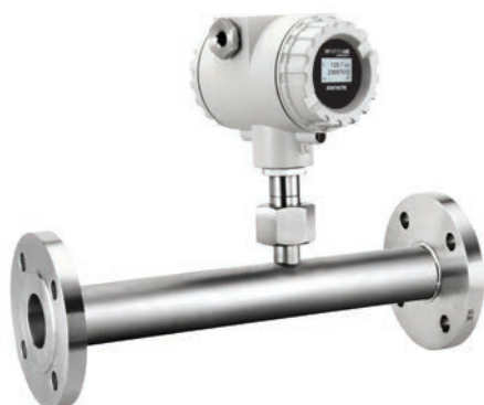
Egalement disponibles assemblés sur section de mesure

En règle générale, tous les mélanges de gaz dont la composition est connue et constante peuvent être mesurés à l'aide du FLOPRO.