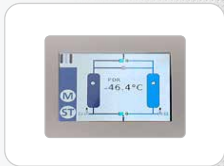
Economiseur d'énergie multi-fonctions (Option)

Facteurs de correction* Toute déviation des paramètres nominaux entraîne l'application des facteurs de correction ci-dessous.